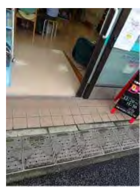
入口の段差はスロープになっているから、車椅子やシルバーカーでも大丈夫。

入口で参加費の300円を支払い、名前シールに記名し、それを胸にペタッとつけて見渡すと、それぞれのテーブルからやさしいまなざしが。どこに座っても自由、テーブルをあちこち回ってもいいし、聞きたいことがどんどん聞けそうです。