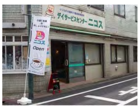
東急目黒線・西小山商店街を歩くこと5分。「のぼり」が目印です。

商店街を歩き、角を曲がると、「Dカフェ・ニコス」ののぼりが。ドアをがらっとあけると、広々とした空間が広がります。さすが、デイサービス。大画面のテレビやマイク、厨房施設などもあり、さまざまなイベントが開催できそうです。靴を脱がずに、まさにカフェの感覚で参加できるのも気軽です。