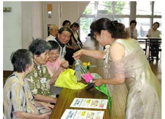
認知症家族会「たけのこ」のミニデイサービス&家族交流会。写真はみんなで手品を楽しむ様子。

この会の特徴は、家族だけでなく、認知症のご本人も参加すること。もちろん、介護者だけで来てもいいわけですが、